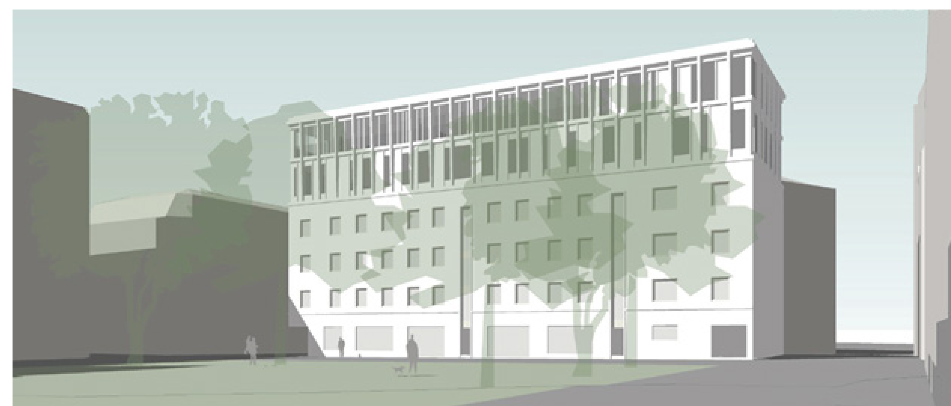
Föreslagen bebyggelse. Vy från Kronhusgatan. Illustration Semrén & Månsson arkitekter.