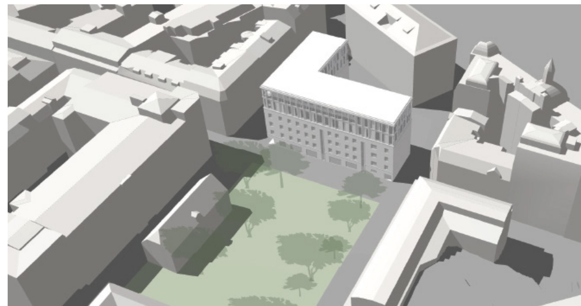
Föreslagen bebyggelse. Vy från nord/öst från Kronhusparken. Illustration Semrén & Månsson arkitekter.