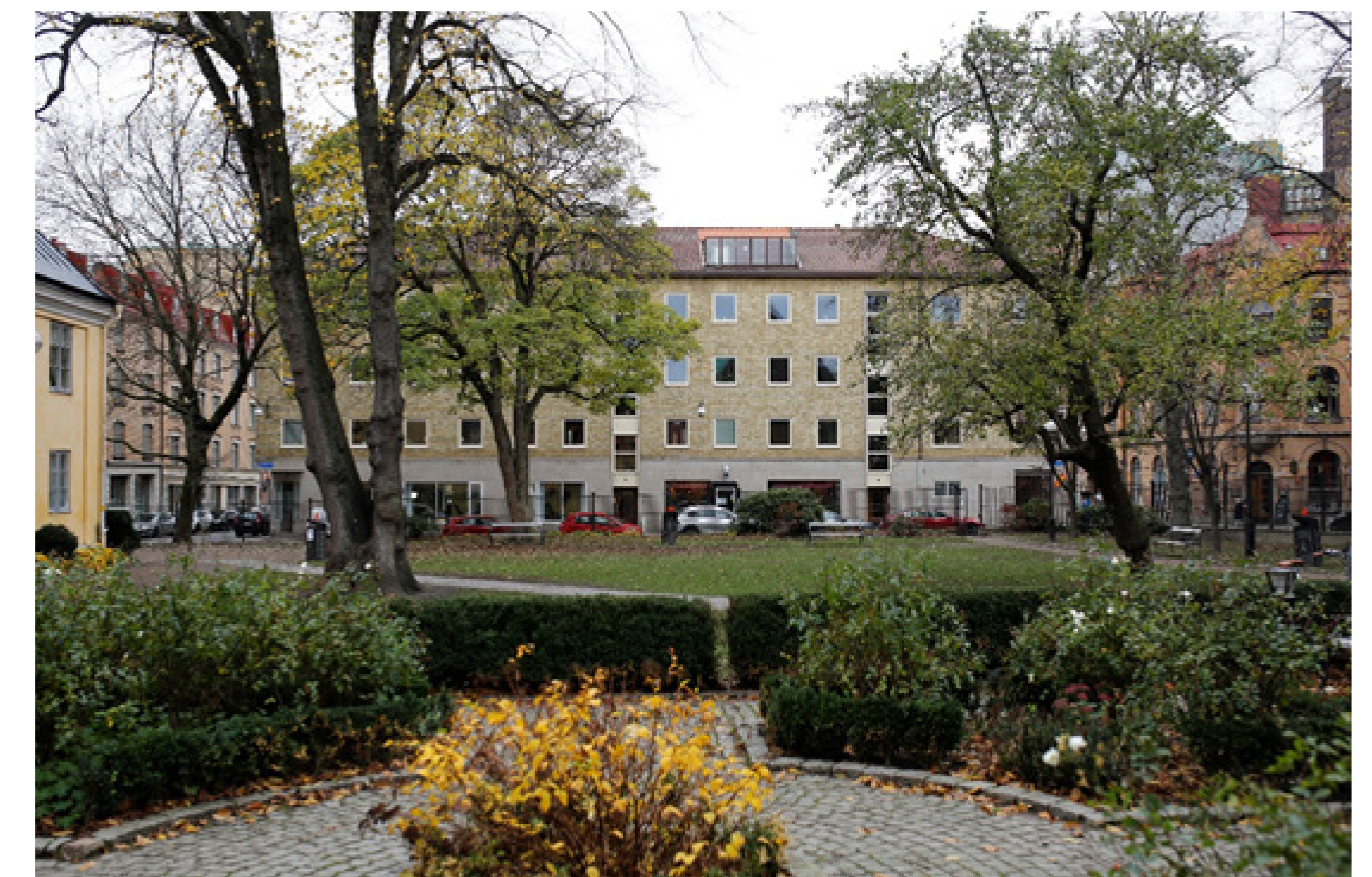
Befintlig bebyggelse. Vy från kronhusparken.